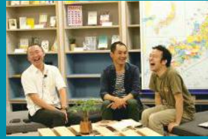
収録は終始なごやかな雰囲気です。

これからの働き方へのヒントがたくさんつまっています。中には、インフラがそろう、多様な働き方への理解も進んでいるような都市でできなかった働き方が、地方に行ったら実現できたといったお話もあります。